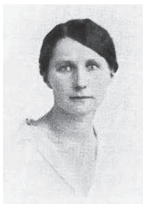
Марии немногим за тридцать