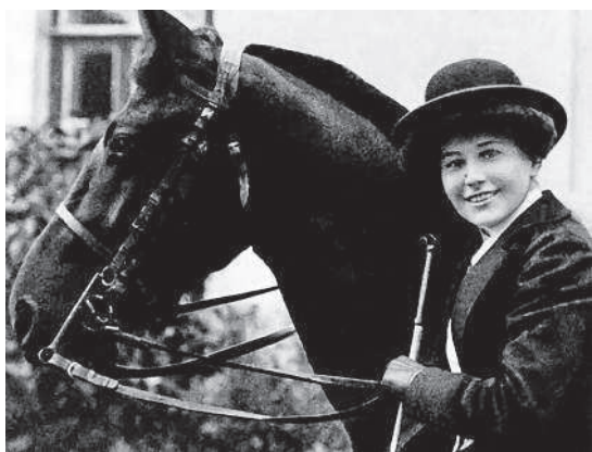
Марии двадцать лет