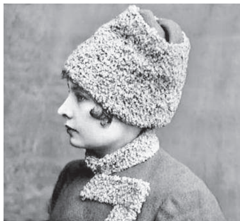
Мужской наряд пока еще маскарадный, à la cosaque

Отношение к женщинам-военным стало меняться лишь с весны 1917 года, когда Мария Бочкарева призвала соотечественниц взять