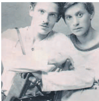
Дедушка и бабушка. Начособотдела дивизии и начособотдела бригады (ну у меня и тены)