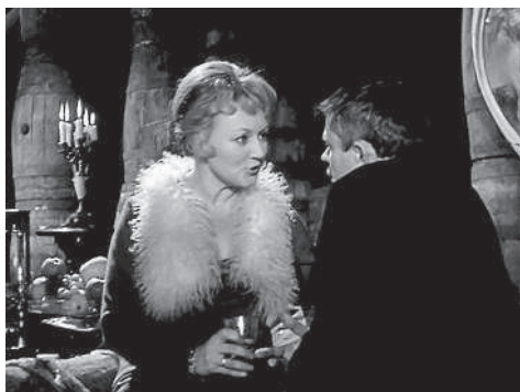
Самая яркая роль фильма

[Кстати говоря, написал про «пятидесятилетие октября» — и вздрогнул. Мальчишкой я смотрел тот фильм про чекистов и белых террористов как сказку про невозможно далекие времена. А ведь 1967 год от наших дней дальше, чем тогда был 1927-ой, когда происходит действие фильма. Пора отмечать пятидесятилетие пятидесятилетия Великого октября. «Что сказать мне о жизни? Что оказалась длинной» (И. Бродский). Но не буду отвлекаться.]