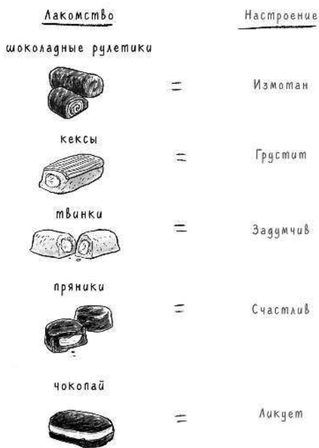
Таблица папиных настроений исходя из предпочитаемых им СЛАДОСТЕЙ

Иногда лакомства могут сочетаться, чтобы выразить всю гамму чувств.