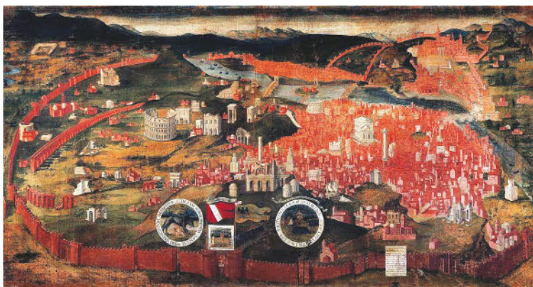
Неизвестный художник. Вид Рима. Фреска в палаццо Дукале в Мантуе. XV в. Хорошо видны прославленные римские древности: Коллизей и арка Константина, колонна Траяна и термы Диоклетиана, статуи Диоскуров на Квиринале, Пантеон и колонна Марка Аврелия, базилика Св. Петра и мавзолей Адриана