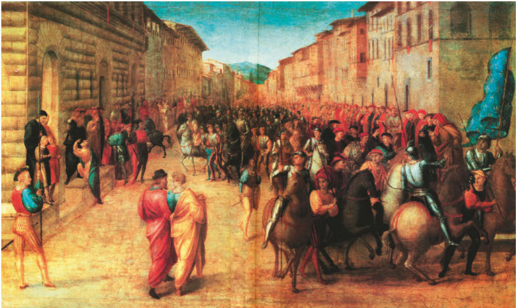
Франческо Граначчи. Вступление Карла VIII во Флоренцию. 1494 Слева — палатца Медичи

жение сочувствия. Не желая подчиняться прежним авторитетам, догмам и нормам, наш подросток сбежал из родительского дома и, не выработав еще правовых и нравственных навыков новоевропейской жизни, вошел в историю во всей красе оголтелой индивидуальности. Его отвратительные черты — оборотная сторона бесспорных достоинств. Его воображаемый портрет, встающий со страниц книги Якоба Буркхардта, так и просится, чтобы его на правах близкого родственника поместили рядом с портретом Карла Смелого работы Жюль Мишле 11 , и он мало чем отличается от портретов других представителей французской и бургундской аристократии XIV–XV веков, выведенных голландским историком Йоханом Хейзингой, этим Буркхардтом Северной Европы, в книге «Осень Средневековья». И не надо думать, будто «ренессансным» вдруг стало все население Европы. Ренессансный человек — явление элитарное. Громадное большинство людей по обе стороны Альп не подозревало ни о том, что на дворе уже Ренессанс, ни о том, что привычный им уклад жизни потом назовут пережитком «темных», или «средних», веков 12 . Так почему мы все-таки называем эту эпоху Возрождением? Что же, собственно, у них там возродилось?