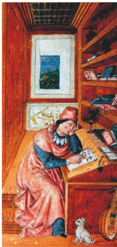
Неизвестный художник. Франческо Петрарка. Миниатюра середины XV в.

в иной опоре под ногами. И вот Античность, им самим идеализированная и потому в высшей степени благородная и героическая, стала его воображаемой прародиной, его спасительным мифом.