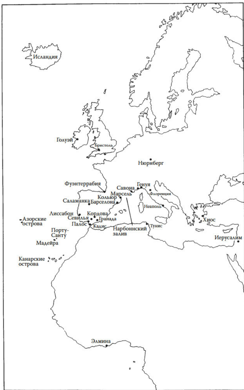
Колумб в Старом Свете