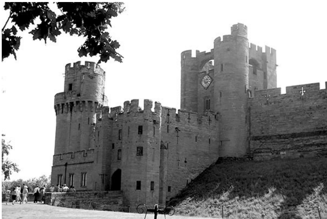
Уорикский замок в Англии

Его сын, Томас де Бьючамп, сделал блестящую карьеру при Идеальном Короле Эдварде III. Герой Кресси и Пуатье – третий, кто стал кавалером ордена Подвязки, он построил в Уорик Кастл две башни, Цезарь Тауэр и Гейтхаус Тауэр. Женат сэр Томас был на дочери Роджера Мортимера, леди Кэтрин. Это был удивительный брак, который много говорит о благородстве и справедливости короля, которому Роджер Мортимер был смертельным и кровным врагом, и о большой любви и преданности, очевидно. Ведь Томаса и Кэтрин поженили совсем крохами, чисто по политическим соображениям. Потом Роджер Мортимер попытался стать королем, жизнь Эдварда была в опасности, но он победил. Таким образом, у Томаса Бьючампа оказалась очень неудобная политически жена, с которой он бы мог развестись очень легко. Но он и не пытался! А король после женитьбы сделал леди Кэтрин одной из первых дам своей королевы. Даже надгробье графа и графини Уорик, где Томас держит леди Кэтрин за руку, много о них говорит, хотя в Англии оно такое не единственное.