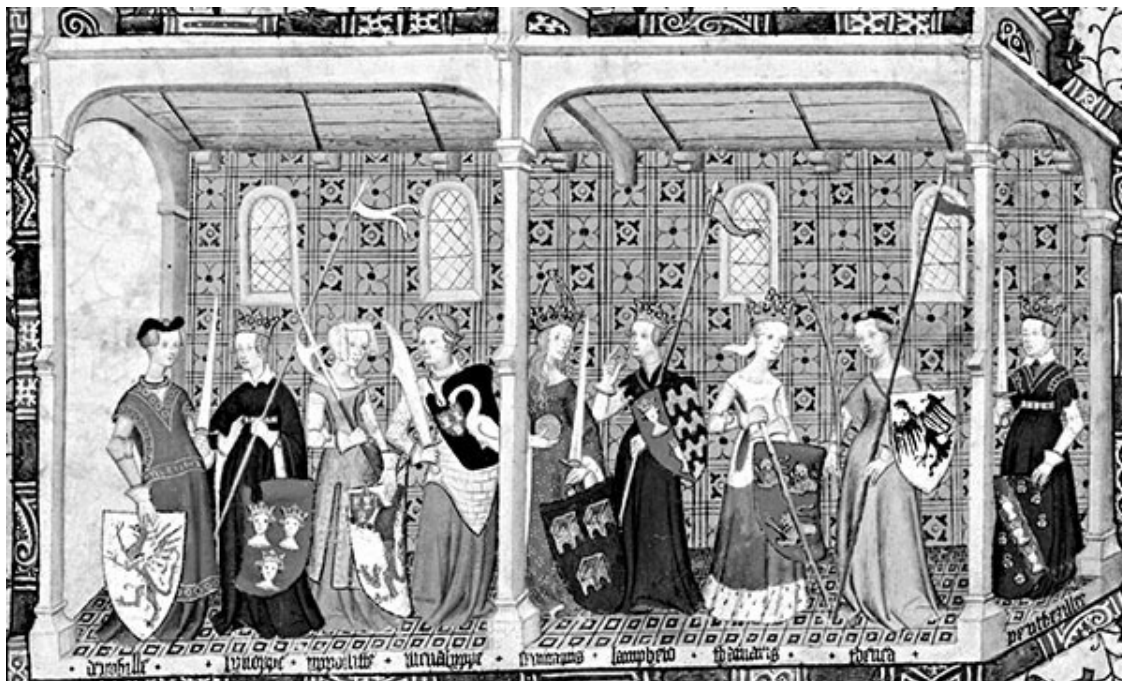
Дамы-рыцари. Из манускрипта «Странствующий рыцарь», 1400 год

Вообще, говоря о женщинах в Средневековье, невозможно обойти стороной жгучий вопрос о том, могла ли женщина быть рыцарем. Не просто защищать свое имущество и своих людей с оружием в руках, но быть формально членом рыцарского ордена? Могла. Поскольку большинство рыцарских орденов были организациями международными, покинем на время чисто английскую территорию.