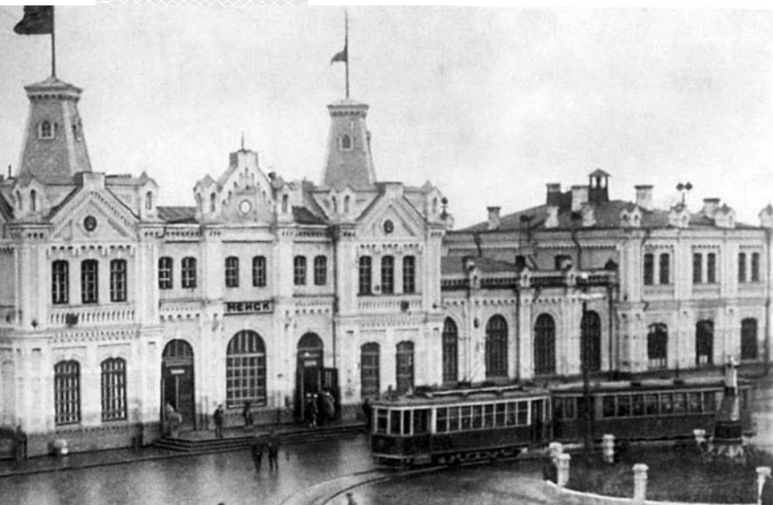
▼ Здание вокзала в Минске. 1920-е годы