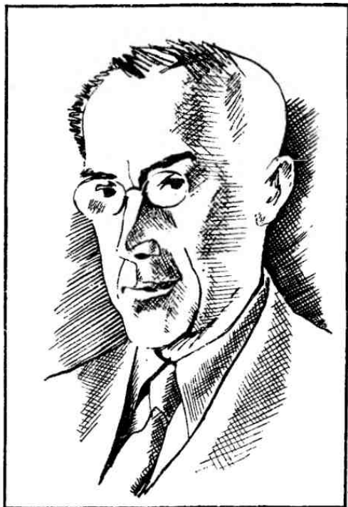
Александр Романович Беляев,

научной фантастики. И недаром его называют «советским Жюлем Верном». Герои Беляева совершают необыкновенные путешествия — вокруг земного шара и на Луну, на Венеру, на внеземную станцию, обитаемый спутник Земли. Они отправляются в глубины океана, в дебри тропических лесов, в неосвоенные просторы Арктики. Если нанести на карту маршруты их путешествий, то линии испещрят нашу планету, уйдут за ее пределы, в околоземное пространство и дальний космос. Они, как и герои Жюль Верна, испытывают удивительные приключе-