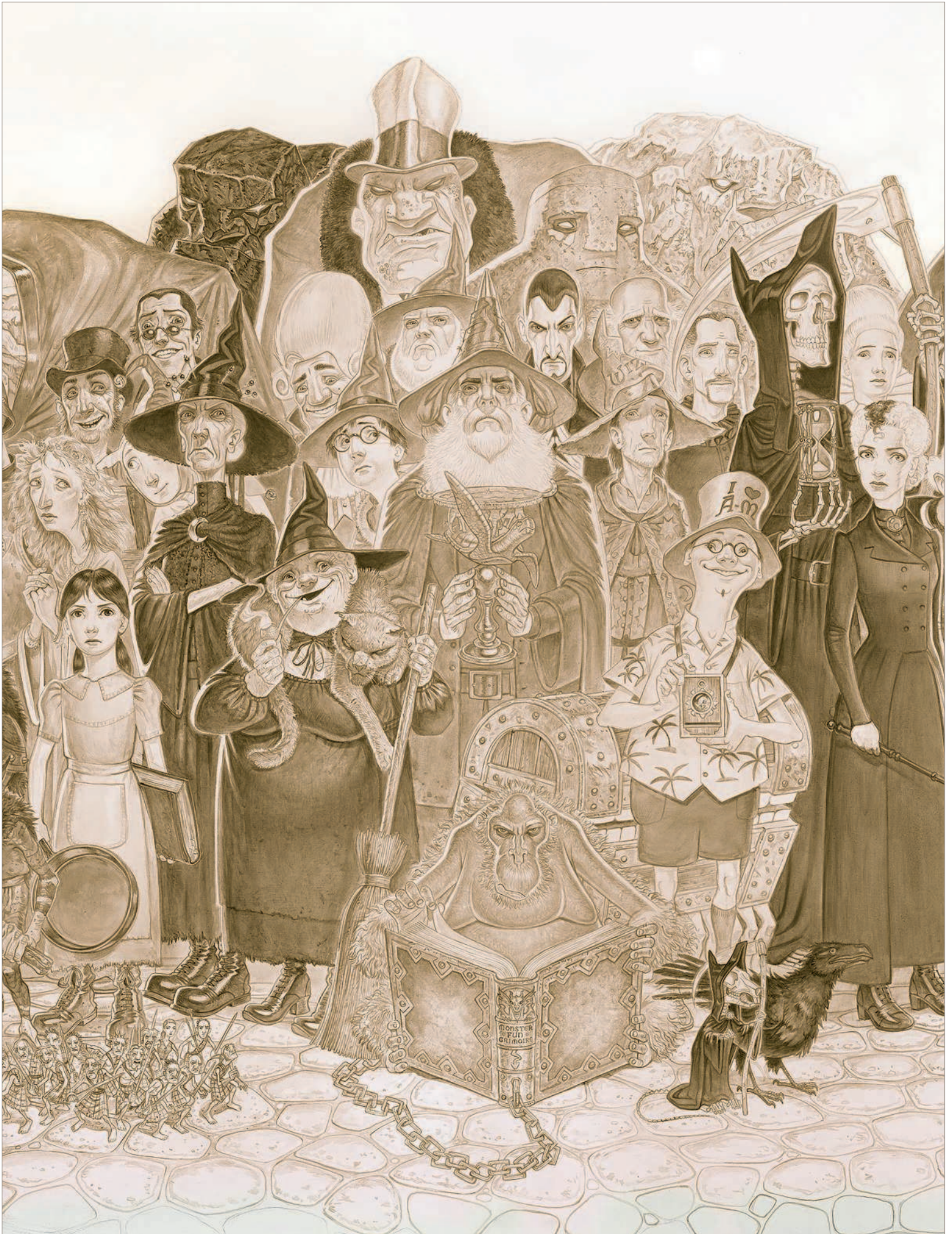
ГЕРОИ ПЛОСКОГО МИРА · ХОЛСТ, АКРИЛ · 101,6 × 152,4 см · 2014