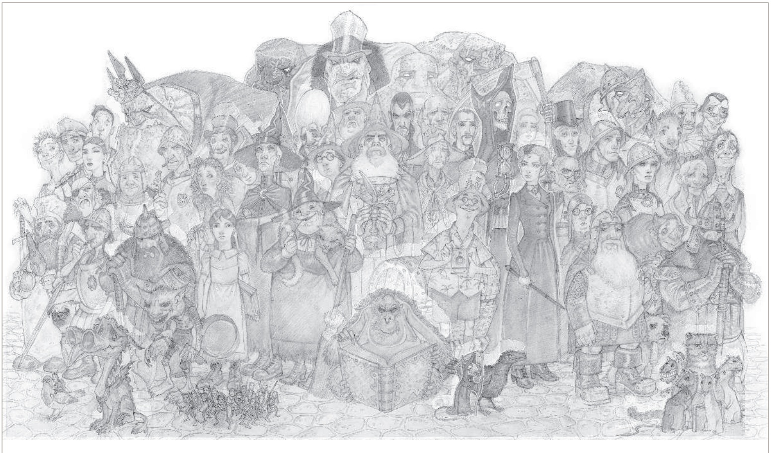
ГЕРОИ ПЛОСКОГО МИРА (ЭСКИЗ) · БУМАГА, ГРАФИТНЫЙ КАРАНДАШ · 37 × 70 см · 2014