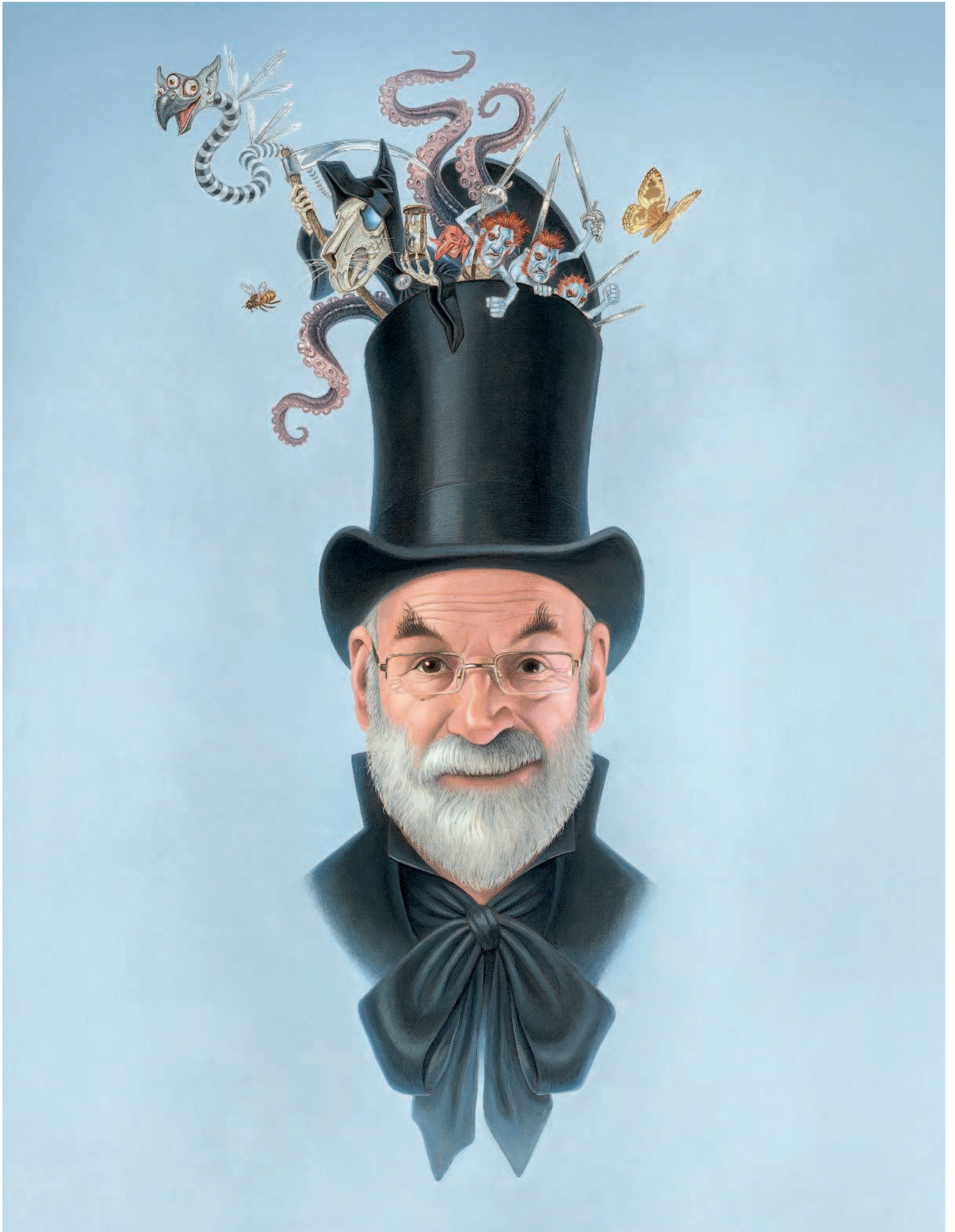
ИМАДЖИНАРИУМ ПРОФЕССОРА ПРАТЧЕТТА · ХОЛСТ, АКРИЛ · 77 x 56 см · 2017