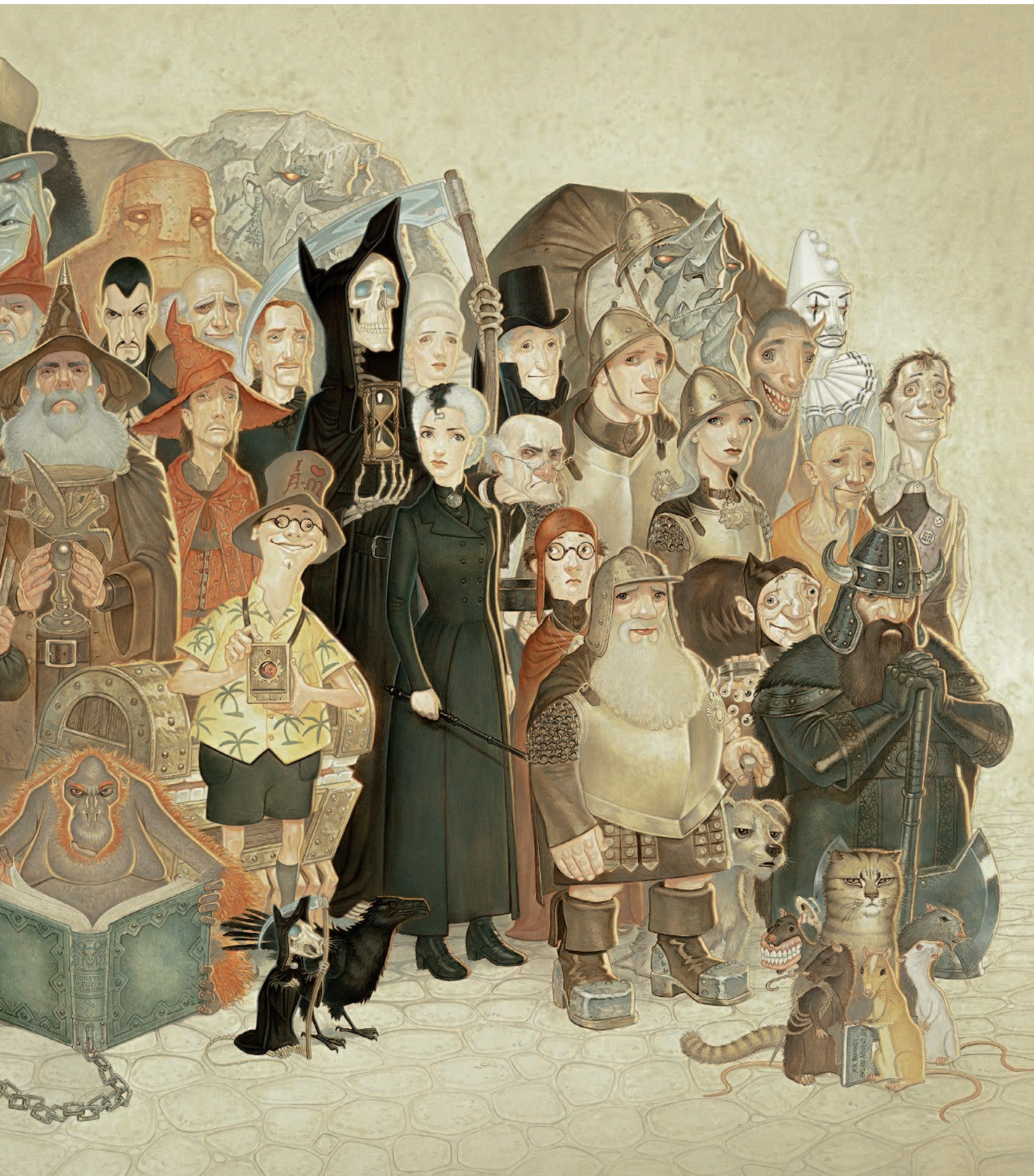
ГЕРОИ ПЛОСКОГО МИРА · ХОЛСТ, АКРИЛ · 101,6 × 152,4 см · 2014