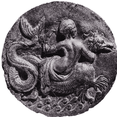
Нереида верхом на ketos (морском чудыще)

Итак, прежде всего необходимо забыть о «сверхъестественном». Однако, чтобы понять, что такое магия древности, нам придется еще много чего выбросить из головы. В нашем мире — особенно на Западе — религия уже давно присвоила исключительное право на взаимодействие с невидимыми силами и субстанциями. В древности такой монополии не существовало. Религиозный институт спонсировался государством, а вера воспринималась как гражданский долг каждого человека; задача религии состояла в том, чтобы поддерживать мир