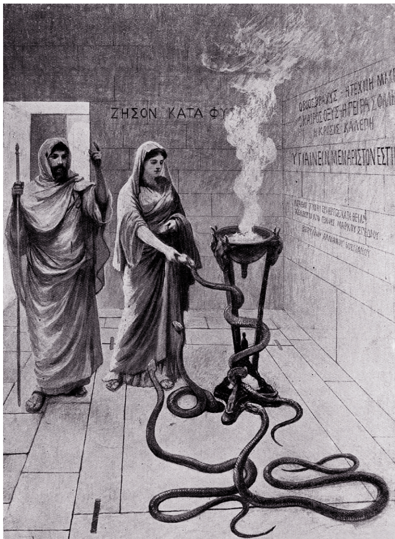
Кормление священных змей в храме Асклепия на острове Кос

Почитать описание, рецензии и купить на сайте МИФА