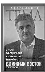
Семён Багдасаров Ближний Восток: перезагрузка