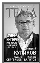
Дмитрий Куликов Судьба империи. Русский взгляд на европейскую цивилизацию