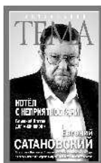
Евгений Сатановский Котёл с неприятностями. Ближний Восток для «чайников»