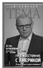
Игорь Прокопенко Противостояние с Америкой. Новая «холодная война»?