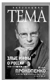
Игорь Прокопенко Злые мифы о России