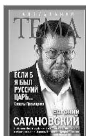
Евгений Сатановский Если б я был русский царь... Советы Президенту