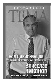
Вячеслав Никонов Код цивилизации. Что ждёт Россию в мире будущего?

Интернет-магазин издательства: https://book24.ru/ В электронном виде книги издательства вы можете купить на www.litres.ru