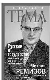
Михаил Ремизов Русские и государство. Национальная идея до и после «крымской весны»