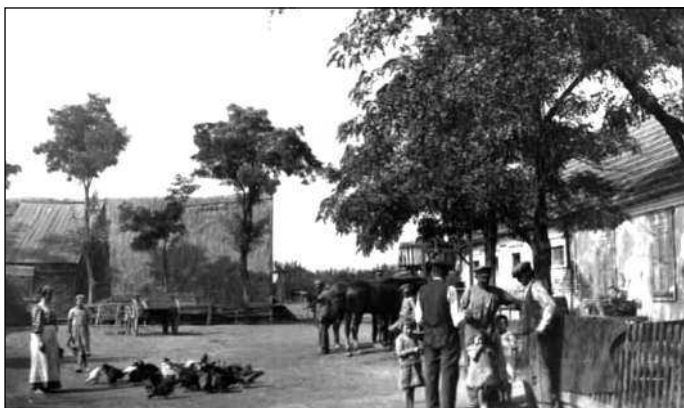
Немцы-колонисты под Одессой, 1918 год

Благодаря особенностям российских регионов некогда единая этническая общность трансформировалась. Появились поволжские, волынские, бессарабские, кавказские немцы. Все они изначально говорили только на родном языке и придерживались своего уклада. Но уже через какое-то время начали отмечать основные русские праздники: Рождество, Пасху и Троицу. Делали это, конечно, пока еще своеобразно — что, однако, не отменяет стремления к полному соответствию социуму.