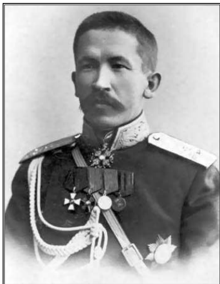
Л.Г. Корнилов. Главнокомандующий Добровольческой армии, главный враг советской власти

она. Этим он показал, что будет делить трудности наравне со всеми. Для него были абсолютно равны и георгиевские кавалеры с полковничьими погонами, и юнкера, и ударники. Глубокий снег и реющий над ним национальный трехцветный флаг объединяли молодую армию. В этом был глубокий символизм.