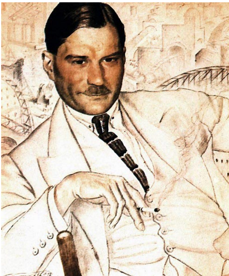
Б. М. Кустодиев Портрет Е. И. Замятина 1923 г.