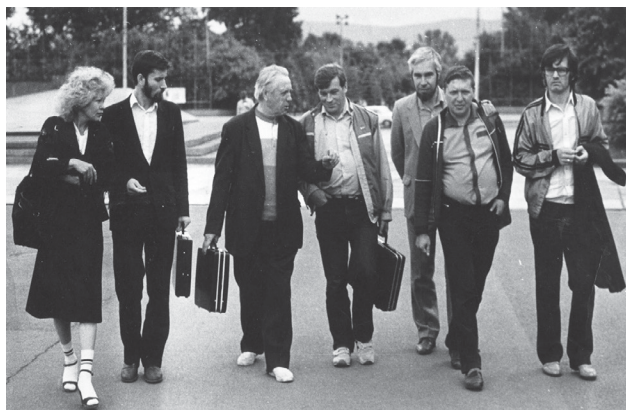
Красноярские писатели и журналисты

Р ассказывая о красноярской литературной среде, невозможно обойти личность Виктора Петровича Астафьева, который переехал на родину в Красноярск в 1980 году признанным «живым классиком», и на протяжении двух десятков лет оказывал значительное влияние на творческую атмосферу города и края: «Это как на фотографии, где засняты всякие мелкие предметы, кладется для сравнения специальная