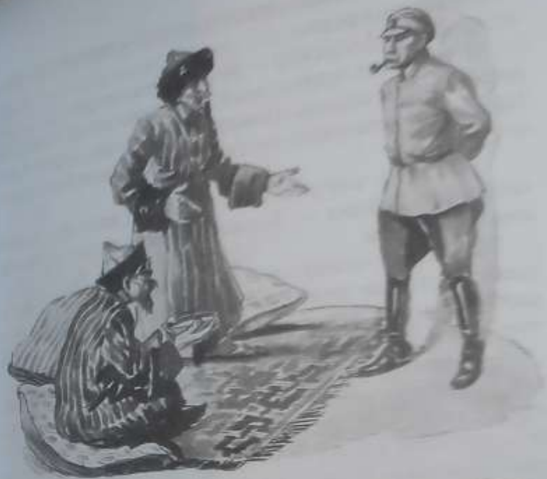
Казы обманули. Один плохой человек уговорил Казы тайно посеять опиум.

— Тогда больше не будет контрабанды. Я поеду на Кару. Там ярмарка. Ты приезжай ко мне завтра. Я соберу мандат (совещание) — закончил он и вышел.