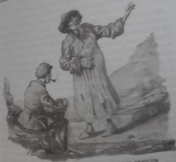
Старик заговаривал медленным глухим голосом

Жанмурчи отошел в сторону, и Кондратий смотрел на старика. Он отшел его в сторону, и они уселись на камень. Тонкие плиты песчаника ломались и звенели, как ледок, под нога-