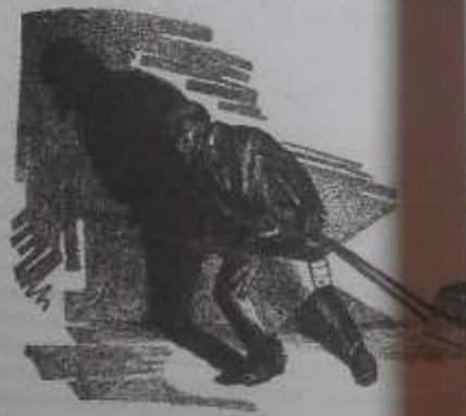
Колодецкий объект: кирпич и выемка доисследованы на до расследования...