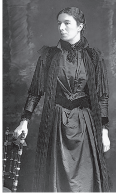
Миссис Хамфри Уорд (Мэри Августа Уорд)