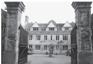
Поместье Гарсингтон. Современный вид