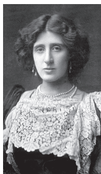
Леди Оттолайн Моррелл