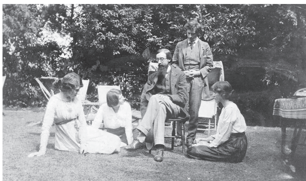
Гости леди Моррелл в ее поместье в Гарсингтоне. Крайняя слева — леди Оттолайн Моррелл, рядом с ней — Мария Нис, будущая жена Олдоса Хаксли

чале войны пытался записаться в армию, но был признан негодным даже к нестроевой службе. Многие его друзья не вернулись с войны. Из 900 преподавателей и студентов Баллиольского колледжа 200 погибли, а еще 200 были ранены 1 . К концу войны Олдос Хаксли сделался убежденным пацифистом и уже никогда не отказывался от убеждения, что любая война — это зло.