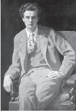
Олдос Хаксли в 1927 году