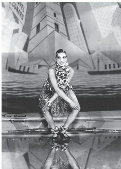
Ревущие двадцатые. Ж. Бейкер танцует Чарльстон