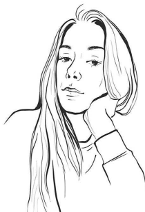
Иллюстрация на обложке и художественное оформление Анастасии Зининой

Художественное оформление серии Анастасии Зининой