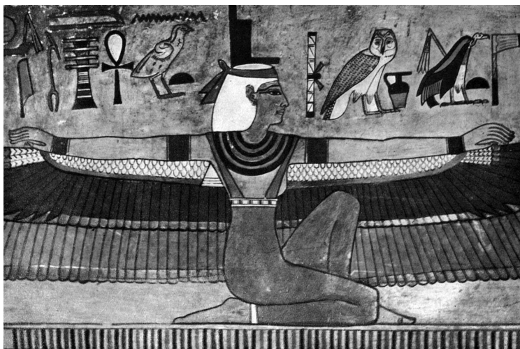
Изображение богини Исиды. Около 1360 г. до н. э.

С рождением нового поколения богов связаны любопытные мифы. Рассказывается, что Геб и Нут так