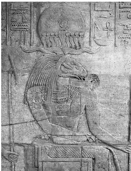
Рельеф, на котором изображен Атум- Ра. Храм Амона в Каве, Древняя Нубия (Судан)

В некоторых мифах говорится, что Ра при рождении имел облик золотого тельца. Изначальные небесные воды в этих мифах предстают в образе коровы с рассыпанными по всему телу звездами.