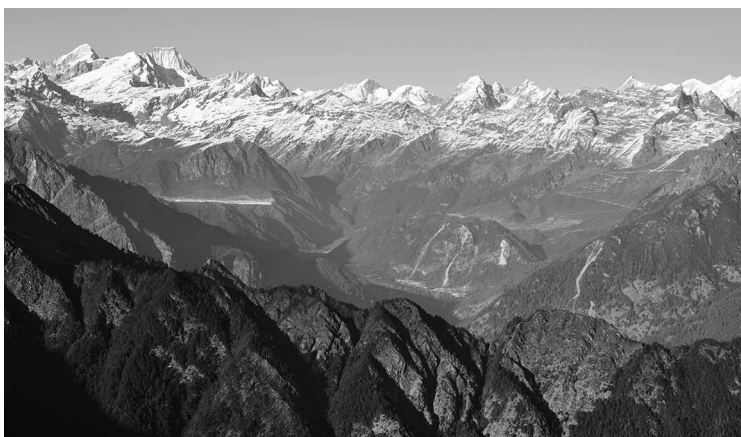
Смотровая площадка в Гималаях. Тибет, Китай

Правда, все-таки самое первое «проникновение» этого слова в «евротекст» случилось в первой четверти I века в сочинении «Плавание вокруг Эритрейского моря», где упоминаются некие «бауты». Схожее слово, однако в немного измененном виде, «баутай», использует поздний римский историк Аммиан Марцеллин, повествуя о людях, которые живут на склонах высоких гор к югу от Серики (так греки и римляне называли Китай).