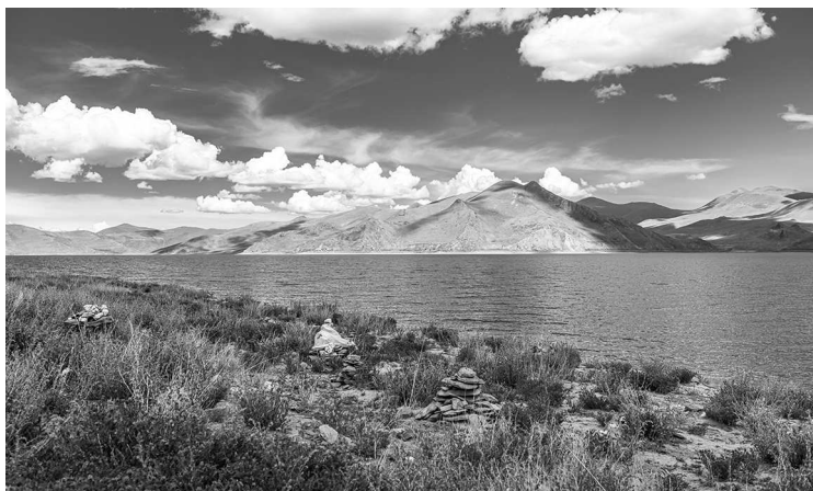
Ямдрок Юмцо — одно из трех священных озер Тибета, Китай

И это притом что производства, кроме кустарного, в Тибете до середины XX века практически не было. Население занималось ремеслами и так называемой домашней промышленностью: скотоводы ткали шерсть, валяли кошмы, крестьяне делали глиняную