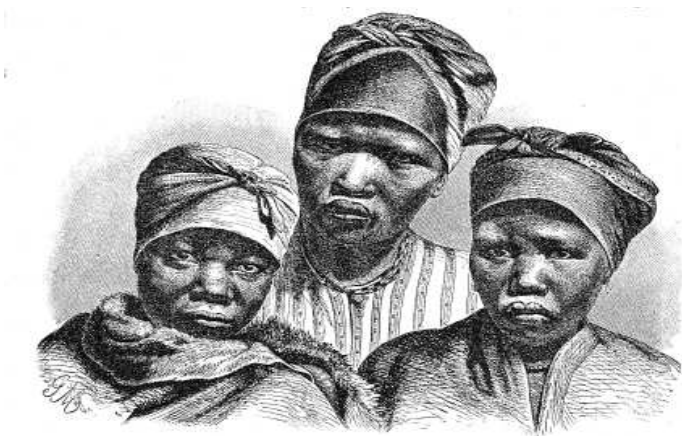
Готтентотки племени номаков

лицо, проводя красной краской круги вокруг глаз и дугообразные линии на лбу и щеках. Только одну свою старинную обувь готтентоты сохранили и до сих пор, они носят сандалии из коры или кожи, в таких сандалиях нога не тонет в сыпучем песке.